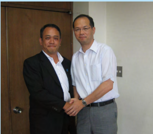
▲樋渡市長とともに

議会基本条例の制定に向けて、議会改革特別委員会を設置、委員として議会の活性化、市民の皆さんにわかりやすい、親しみやすい議会を目指して議論を重ねています。