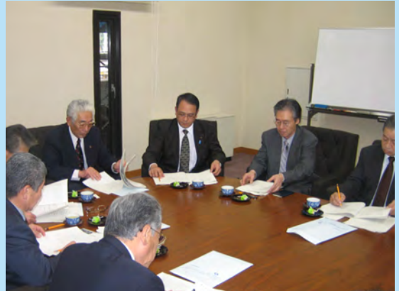
▲清和会で大分市議会を視察